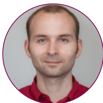
ГОРДЕЕВ Андрей Григорьевич

Дата рождения: 17.12.1974 Проживание: Москва, ЦАО, район Якиманка Образование: высшее, инженер-системотехник, экономист, Executive MBA Глава муниципального округа Якиманка Избирательный округ №2 Выдвинут Российской объединенной демократической партией «ЯБЛОКО» Беспартийный